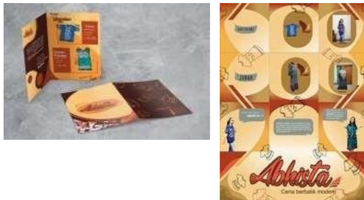
Gambar 2. 1 Pengapliaksian media brosur dan feed instagram Batik Abhista

Jurnal yang berjudul Perancangan Media Promosi Batik Abhista Tuban (Yusron & Kusumandyoko, 2022) membahas beberapa hal mengenai UMKM Batik Abhista Tuban yang sedang diteliti, metode penelitian yang digunakan menggunakan kualitatif dengan pengumpulan data yang digunakan pada jurnal ini meliputi observasi, wawancara, dan dokumentasi. Kemudian, jurnal ini juga menggunakan Analisis SWOT untuk menganalisis data terkait. Dari beberapa pembahasan tersebut menerangkan bahwa penulis telah meneliti data UMKM Batik Abhista Tuban. Maka konsep perancangan yang digunakan penulis dengan menggunakan strategi komunikasi periklanan seperti : Komunikasi langsung, komunikasi tidak langsung, dan komunikasi persuasif. Selain itu media yang digunakan adalah brosur, feed instagram, spanduk, Google business , x-banner, dengan mengambil tema modern guna merepresentasikan kesan modern pada