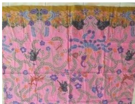
Gambar 2. 15 Motif Baluran Menunggu

Motif ini tergolong motif yang rumit dan sulit dalam proses pengerjaannya, karena menggunakan motif hewan khas yang ada di Baluran yaitu Banteng, Burung Merak dan Rusa. Namun tetap menggunakan motif kerang karena telah menjadi khas Kabupaten Situbondo.