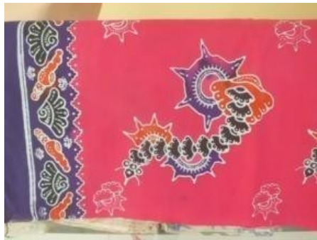
Gambar 2. 12 Motif Lerkeleran

digunakan adalah kerang, perbedaannya terletak pada motif lerkeleran menggunakan 1 motif kerang besar dengan 11 kerang kecil. Motif ini memiliki filosofi budaya yang tertib sesuai dengan bentuk dari motif itu sendiri. Karena dalam kehidupan sehari-hari manusia tidak lepas dari kata tertib, karena hal ini merupakan landasan agar mencapai sebuah kesuksesan.