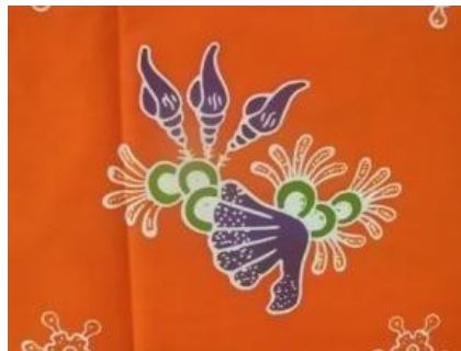
Gambar 2. 11 Motif Kerang Gempel

Kerang gempel dalam bahasa Madura memiliki arti kerang pecah. Penggunaan motif berbentuk pola dengan susunan yang tidak teratur. Motif ini memiliki aksan retak sejalan dengan arti dan filosofi dibalikinya bahwa di dunia ini tidak ada yang sempurna. Sama halnya dengan pepatah tak ada gading yang tak retak, artinya tidak satupun di dunia ini yang sempurna, kecuali Tuhan Yang Maha Esa.