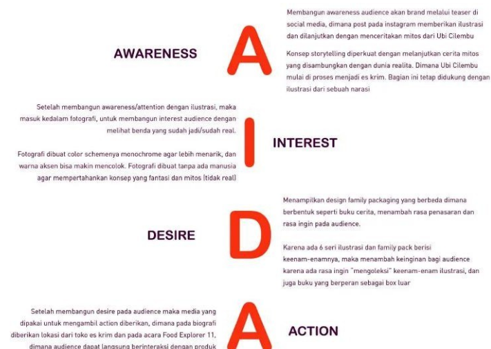
Gambar 2. 9 Penjelasan AIDA

AIDA dapat diartikan sebagai sebuah proses untuk melakukan pemasaran. AIDA juga bisa menjadi pedoman untuk menjalin hubungan dengan calon konsumen ataupun konsumen (Hananto, 2019).