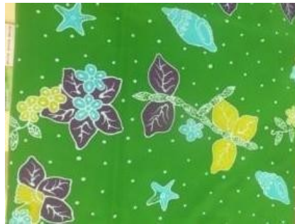
Gambar 2. 14 Motif Malate Sato'or

Malate sato'or dalam bahasa Madura memiliki arti seikat melati. Motif ini tergolong motif tumbuhan dengan perpaduan motif kerang yang menjadi motif utama Batik Situbondo. Motif ini memiliki filosofi lambang kesucian atau kebaikan. Bunga melati mengajarkan bahwasanya manusia janganlah bersifat sombong dan angkuh.