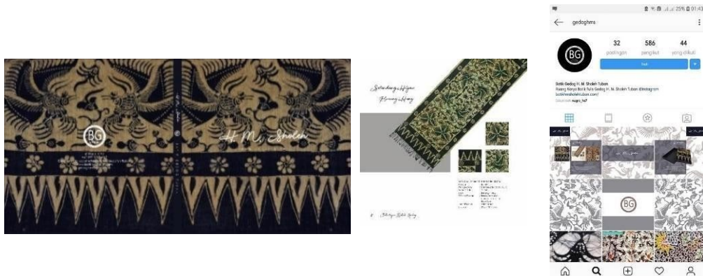
Gambar 2. 2 Pengaplikasian katalog

motif batik. Dalam proses perancangan penulis melewati 2 tahap yaitu thumbnail , dan digital . Teknik yang digunakan pada perancangan ini adalah teknik vector .