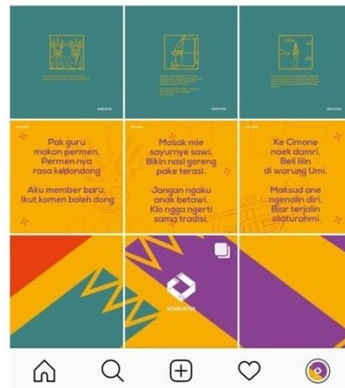
Gambar 2. 3 Desain feed instagram pada perancangana media promosi Batik Betawi