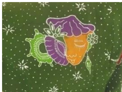
Gambar 2.13 Motif Kerang Bertopeng

Motif ini tergolong motif hewan dengan bentuk non geometris yang memiliki makna kejujuran. Motif ini memiliki makna kejujuran merupakan pangkal dari kebaikan, jadi apabila kita selalu berkata jujur maka kebaikan akan menyertai selama hidup kita.