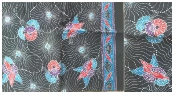
Gambar 2. 19 Motif Gelang Bahari

Motif ini adalah hasil perkembangan dari kerang, daun, dan bunga dengan aksen titik dan garis. Motif ini memiliki makna gotong royong dalam nelayan karena nelayan memiliki tugas mencari nafkah untuk keluarganya. Selain itu motif ini bermakna dengan bersama hal apapun akan menjadi mudah.