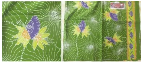
Gambar 2. 18 Motif Jaring Samudra

Motif ini hampir memiliki kesamaan dengan motif lainnya menggabungkan motif kerang dan daun yang menjadi pembeda adalah garis gelombang yang lebih mendominasi pada motif batik ini. Motif ini merupakan motif apresiasi kepada masyarakat Situbondo yang berprofesi sebagai nelayan.