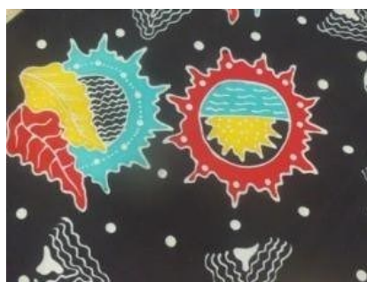
Gambar 2. 17 Motif Sonar Are

Motif Sonar are dalam bahasa Madura adalah cahaya matahari. Motif ini memiliki motif pengembangan motif matahari, daun dan laut. Motif ini memiliki motif lain seperti gelombang, titik titik. Selain itu motif ini memiliki makna keikhlasan.