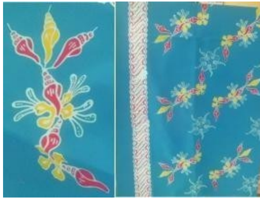
Gambar 2. 10 Motif Batik Tale Percing